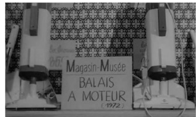
extraits du film « l'an 01 »